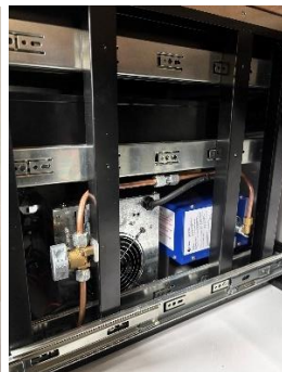
230V + Gasheizung